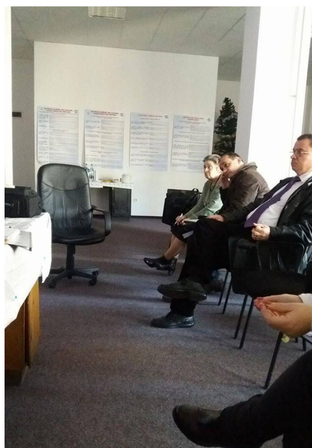
Workshop BONY 4, 21 februarie 2017 Institutul de Chimie-Fizica „Ilie Murgulescu” al Academiei Romane, Bucuresti